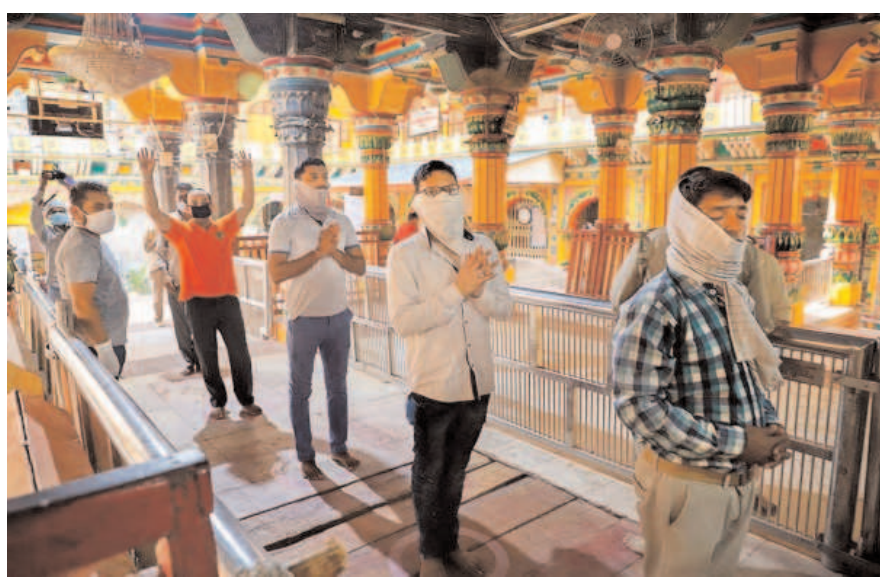
Devotees maintain social distance while waiting in a queue at Sri Dwarkadheesh temple after it re-opened following the ease of lockdown restrictions, in Mathura.