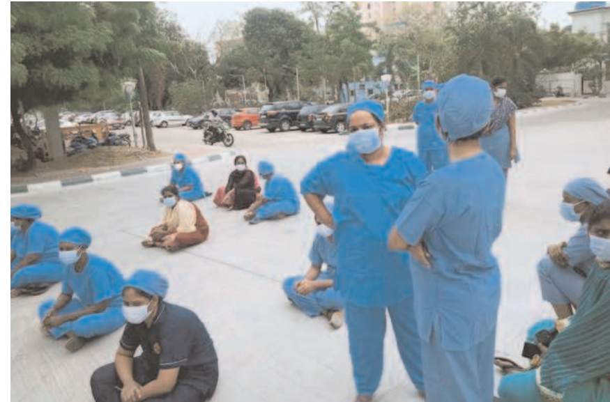
Nurses at Omandurar Government Hospital stage a protest over alleged shortage of staff to attend to COVID-19 patients, in Chennai.