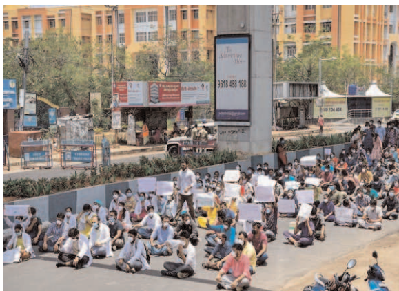
PG doctors stage a protest against alleged misbehavior and manhandling of doctors treating COVID-19 patients during the nationwide lockdown, near Gandhi Hospital in Hyderabad. Junior doctors at Hyderabad's Gandhi General Hospital, the nodal hospital for treating Covid-19 patients in Telangana, staged a protest after attendants of a deceased patient allegedly attacked junior doctors on duty.